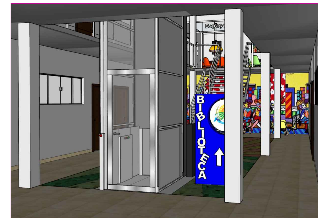
VISTA ACESSO A BIBLIOTECA SEM ESCALA