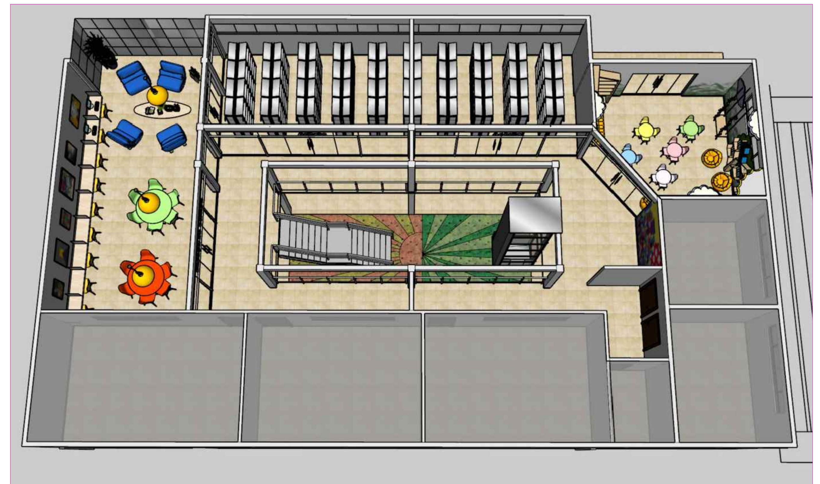
VISTA LAYOUT SEM ESCALA