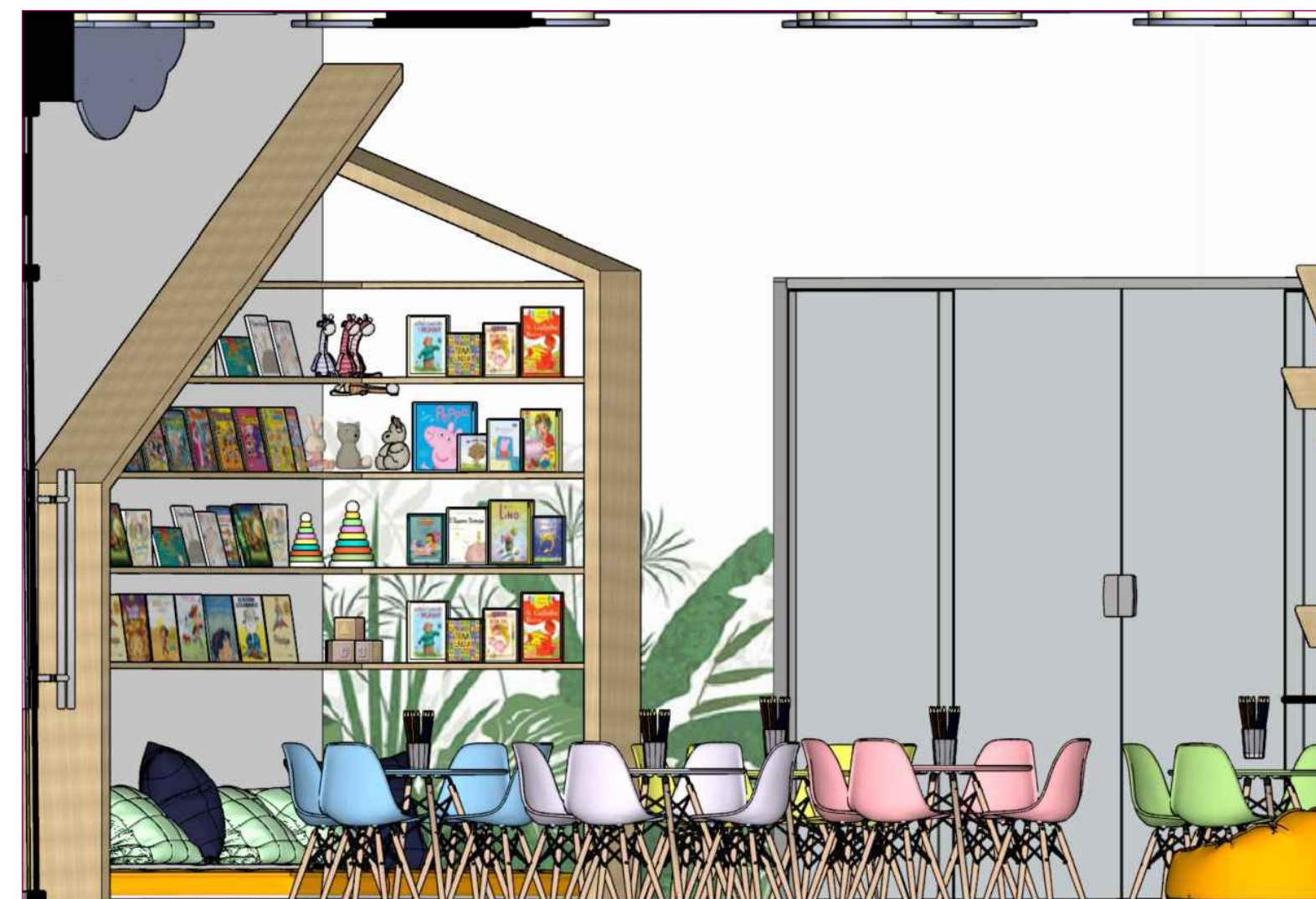
VISTA ESPAÇO INFANTIL SEM ESCALA