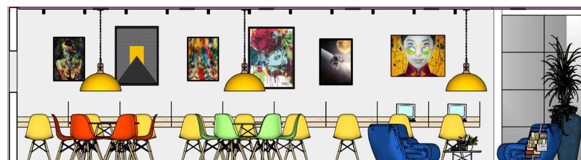
VISTA SALA DE LEITURA SEM ESCALA